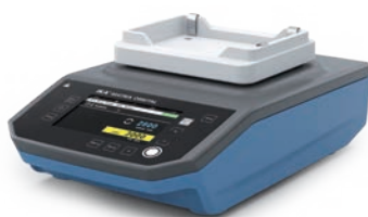
Matrix Orbital 恒温摇床 订货号 0030000627