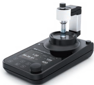
ElectraSyn 2.0 Package 电化学合成套装 订货号 0020008980