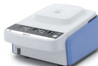
G-L 离心机 订货号 0030000774