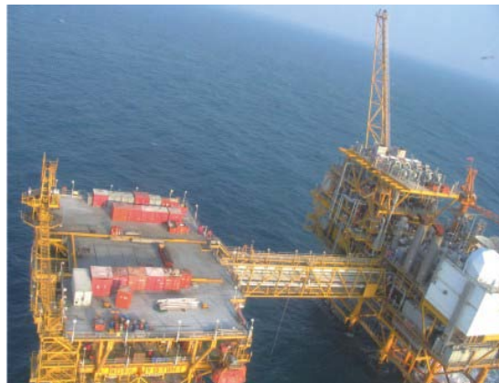
中海油海上平台应用