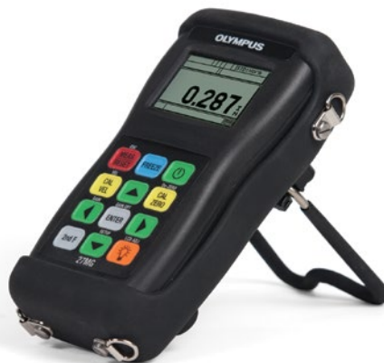
装有可选橡胶保护套的27MG测厚仪, 保护套上带有颈挂带和仪器支架

根据您所在地区的不同, 标准套件可能会有所不同。 要了解详细情况, 请联系您所在地的经销商。