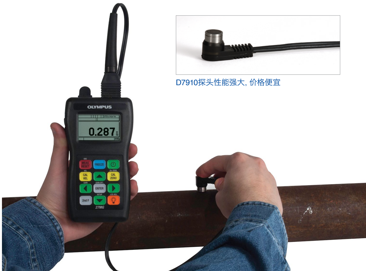
D7910探头性能强大, 价格便宜

27MG测厚仪的标准配置中包含经济实用的D7910双晶探头，用户使用这款探头可以完成很多基本腐蚀应用的测厚操作。奥林巴斯还备有种类齐全的双晶探头系列产品，可以对极薄、极厚的材料，或小直径管件进行测量。与27MG测厚仪兼容的奥林巴斯探头带有自动探头识别功能，可通过自动调用默认V声程校正的方式，优化探头的性能。