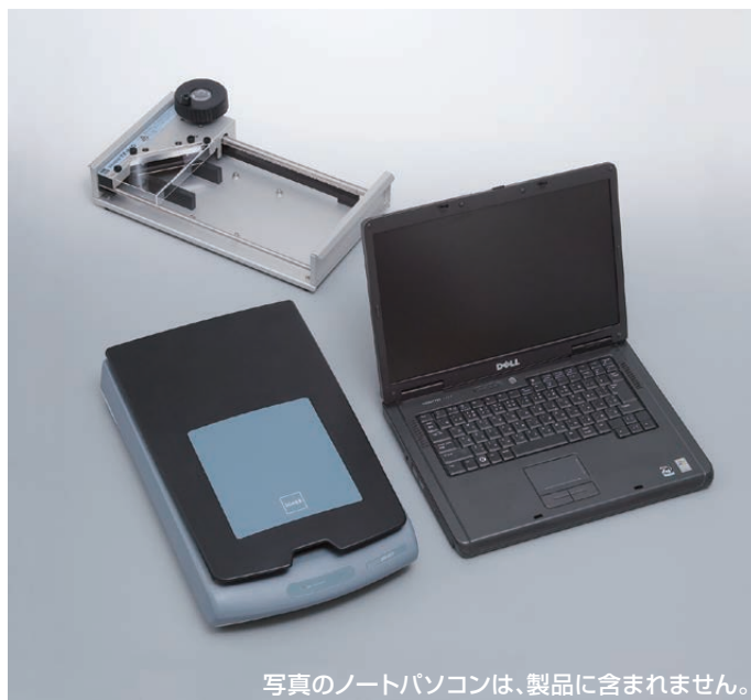
写真のノートパソコンは、製品に含まれません。

本器を使用することにより、農業共済の的確な被害申告や、共同乾燥施設等への仕分け入荷に活用できます。なお本器は、独立行政法人 農業・食品産業技術総合研究機構 九州沖縄農業研究センターとの共同開発製品です。