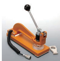
粉体用定圧センサ