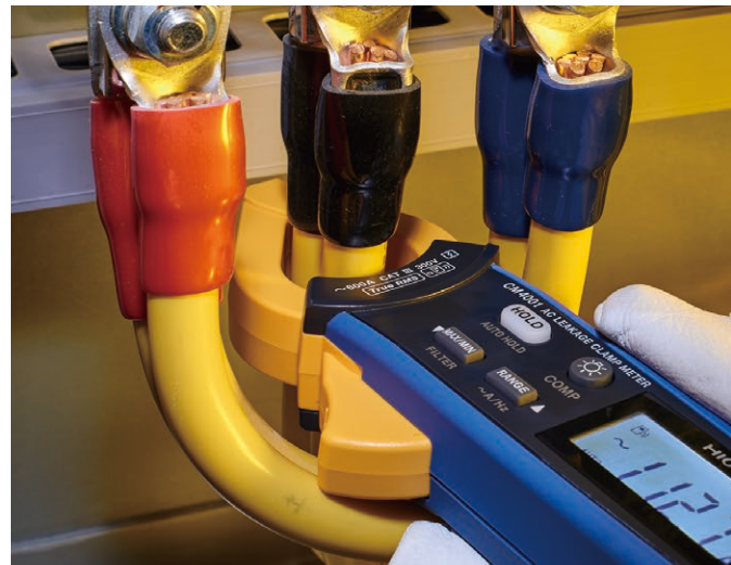
即使是间隔很小的电缆或是双重电缆都可顺利夹住