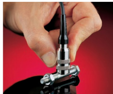
V 型槽设计用于测量小直径物体