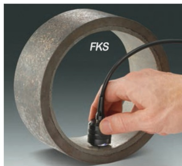
大量程探头系列用于厚的保护层, 如环氧树脂、橡胶、防火涂料等