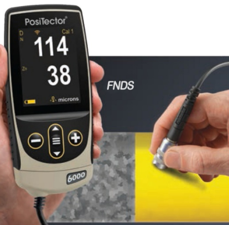
FNDS 探头专门设计为测量镀锌板上的层, 可同时分别测出锌层和涂层的厚度