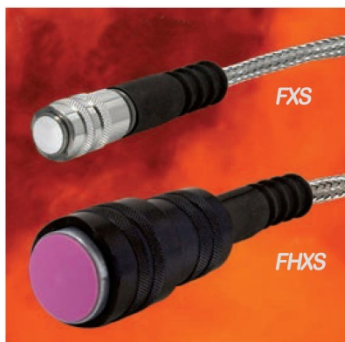
FXS 和 FHXS 探头应用于表粗糙和 250°C 高温面