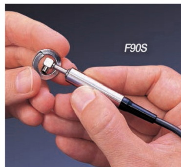
微型探头适用于小零件, 以及难以测量的区域